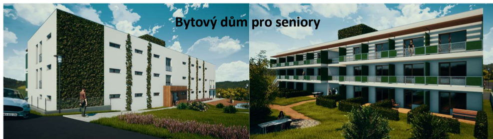
Bytový dům pro seniory

Máme komplet hotovou projektovou dokumentaci pro bytový dům pro seniory a přilehlou komunikaci a inženýrské sítě. Čeká nás vyřizování stavebního povolení a také konečná debata a tom, pro koho přesně budou byty určeny a také jakým způsobem budeme stavbu financovat. Pokud se toto podaří zúradovat, tak bychom mohli na podzim podat žádosti o dotace a v optimistické variantě v roce 2022 začít se stavbou. Dále zpracováváme záměr na přístavbu Staré školy, kde by vznikly prostory pro knihovnu, která by se přestěhovala z budovy Základní a mateřské školy. Již je také hotov projekt na cyklostezku z Ráječka do Rájce. Pracujeme na zajištění souhlasů majitelů pozemků se stavbou. Několik dalších záměrů diskutujeme a připravujeme k realizaci.